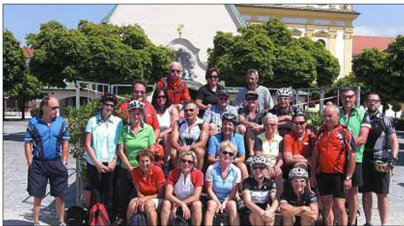
Die Gnadenskapelle im Rücken stellten sich die Radler der Altötting-Fahrt zum Gruppenbild.

Otzing. Bereits zum siebten Male schwangen sich die Radler des SRC Otzing auf den Sattel, um den Kapellplatz im oberbayerischen Altötting anzusteuern. Am Treffpunkt herrschte um 8 Uhr bei den 30 Radlern bereits gute Stimmung. Das Wetter versprach bestens zu werden und neben „einigen Neuzugängen“ fanden sich auch viele „Wiederholungstäter“ für die diese Wallfahrer-Radtour ein, die mit ihren 90 zurückzulegenden Kilometern zu den festen Einrichtungen der SRC-Sommersaison gehört. Der anfangs noch ziemlich kräftige Gegenwind legte sich spätestens am Bockerlradweg in Landau,